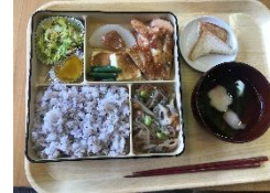
ギャロップさんのランチ 日替わりです！