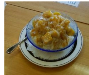
↑し～ま茶房のマンゴーかき氷です。練乳付きでとってもゴージャス！